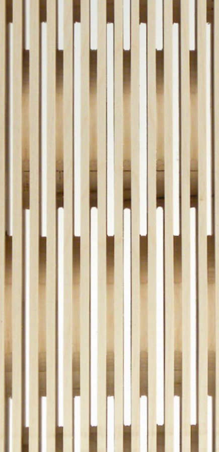
front & back side: 4/4 mm, 3-layer spruce