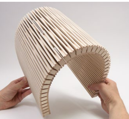
4/4 mm, 3-layer spruce