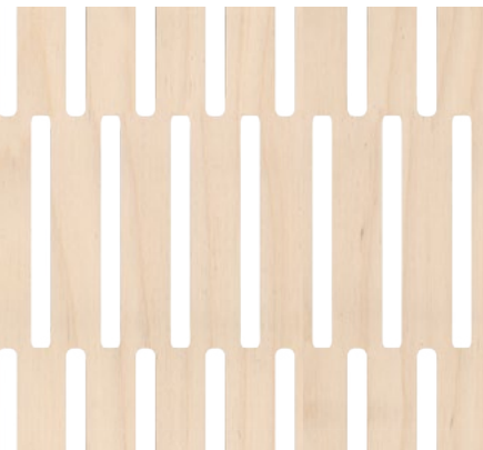
back side: 4/4 mm, plywood birch