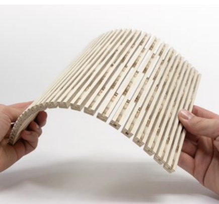
4/4 mm, plywood birch 10 mm